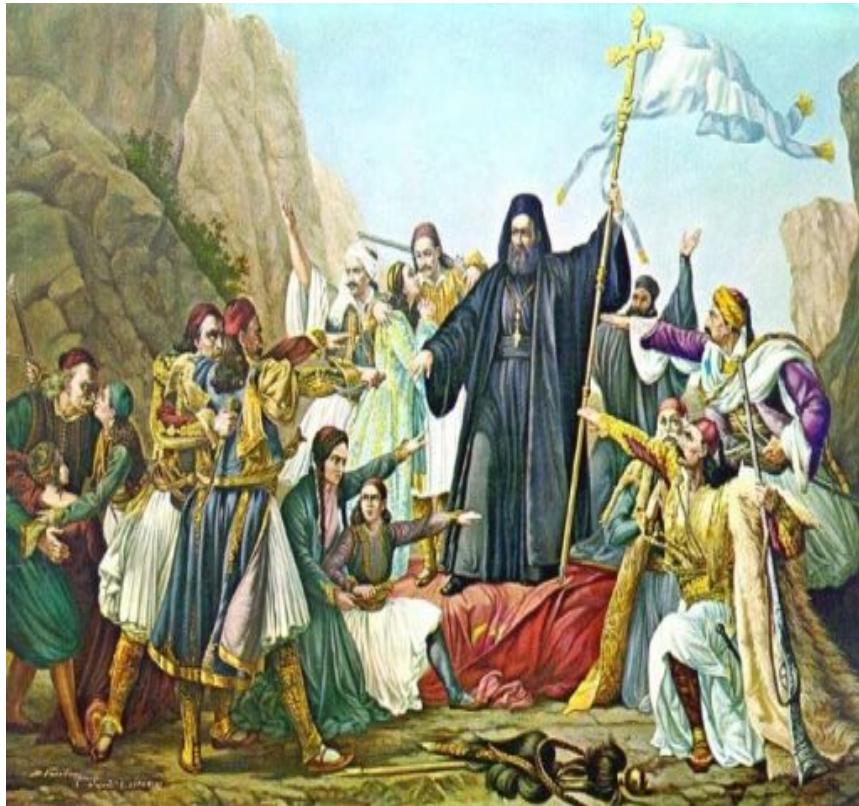
Ο Παλαιών Πατρών Γερμανός υψώνει τη σημαία της Επανάστασης, Ludovico Lipparini (1800-1856)